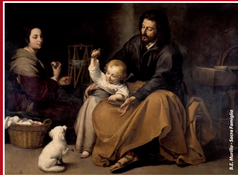
B.E. Murillo - Sacra Famiglia

“Il sogno di una sola famiglia si costruisce insieme”